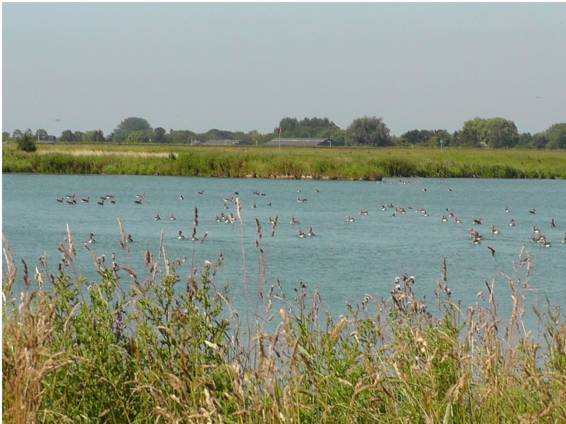
Grauwe ganzen vluchten de plas op (augustus 2013)