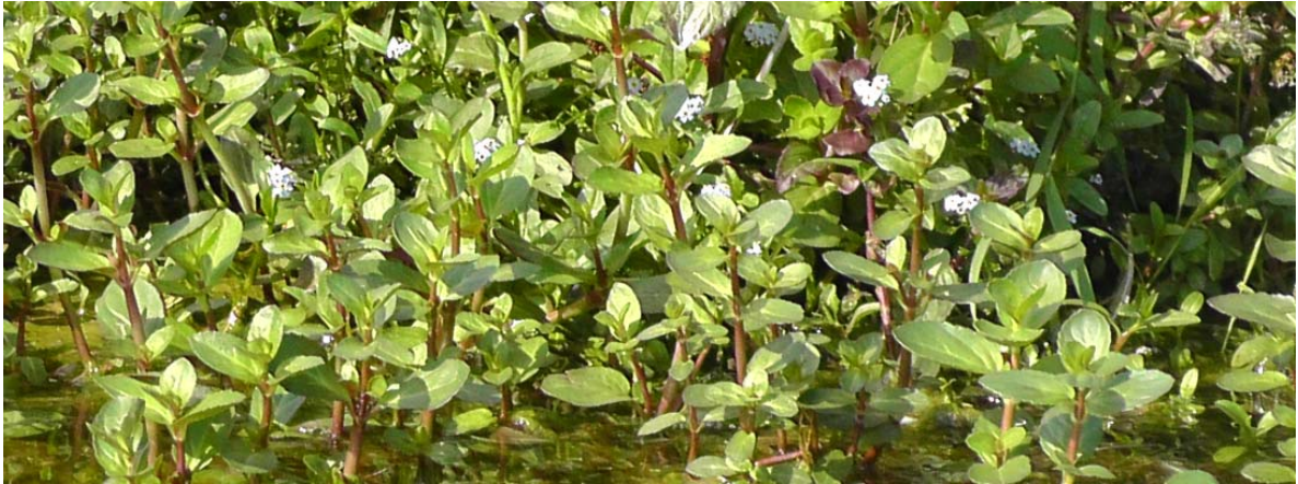
Figuur 4. Veld met Beekpunge ( Veronica beccabunga ) in de noordwestelijke oever van de zandput