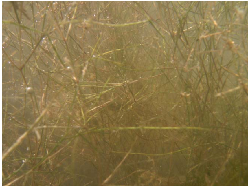
Figuur 2. Veld met Schedefonteinkruid ( Potamogeton pectinatus )

In tabel 2 zijn in groen aangegeven de soorten die volgens van den Brink (1990) kenmerkend zijn voor (grotere) wateren die niet worden geïnundeerd. Bij toenemende inundatie nemen ondergedoken waterplanten af door afnemende zichtdiepte en planten met drijfbladeren zoals Gele plomp en Watergentiaan, nemen hun plaats in als de inundatiefrequentie < 20 dagen/jaar blijft. Bij toenemende inundatiefrequentie verdwijnen alle waterplanten (van den Brink, 1990).