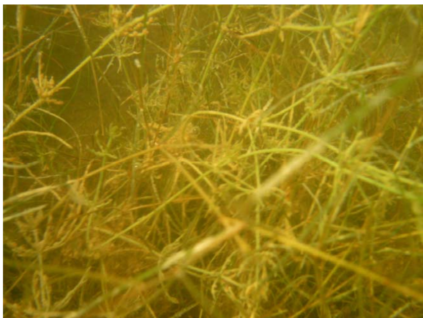
Figuur 3. Velden met kranswieren ( Chara vulgaris met var. longibracteata en var. papillosa )

Het voorkomen van hogere waterplanten, vooral schedefonteinkruid en kranswieren is een kwaliteit van de zandput. Dit betekent dat in de smalle ondiepe zone, voldoende licht doordringt en de concentratie aan algen hier de groei van waterplanten niet onderdrukt. Dit is een waarde voor de waterplanten zelf, maar ook voor de macrofauna op de waterplanten en de vissen die er tussen kunnen schuilen en op het oog jagen (snoek). Voor de beoordeling van de KRW wordt aansluiting gevonden met watertype M14: “Ondiepe (matig grote) gebufferde plassen”. De KRW score is goed (0,65).