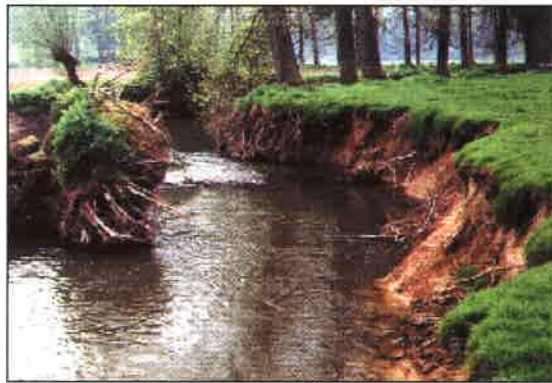
Fig. 2. Geul bij St. Gerlach. Door de boom wordt de stroomgeul verbreed.

visstand van groot belang. Behning (1932) was verbaasd over de enorme rijkdom aan vis in de Ural ten opzichte van de Wolga. Dit grote verschil bleek te worden veroorzaakt doordat in de Wolga wel alle bomen werden verwijderd ten behoeve van de scheepvaart, maar in de Ural nog niet.